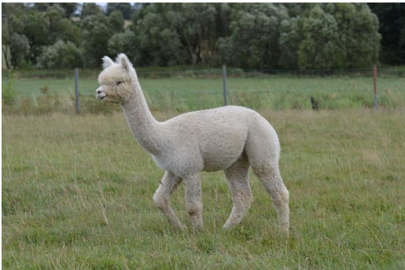
Alpaka Foto 2